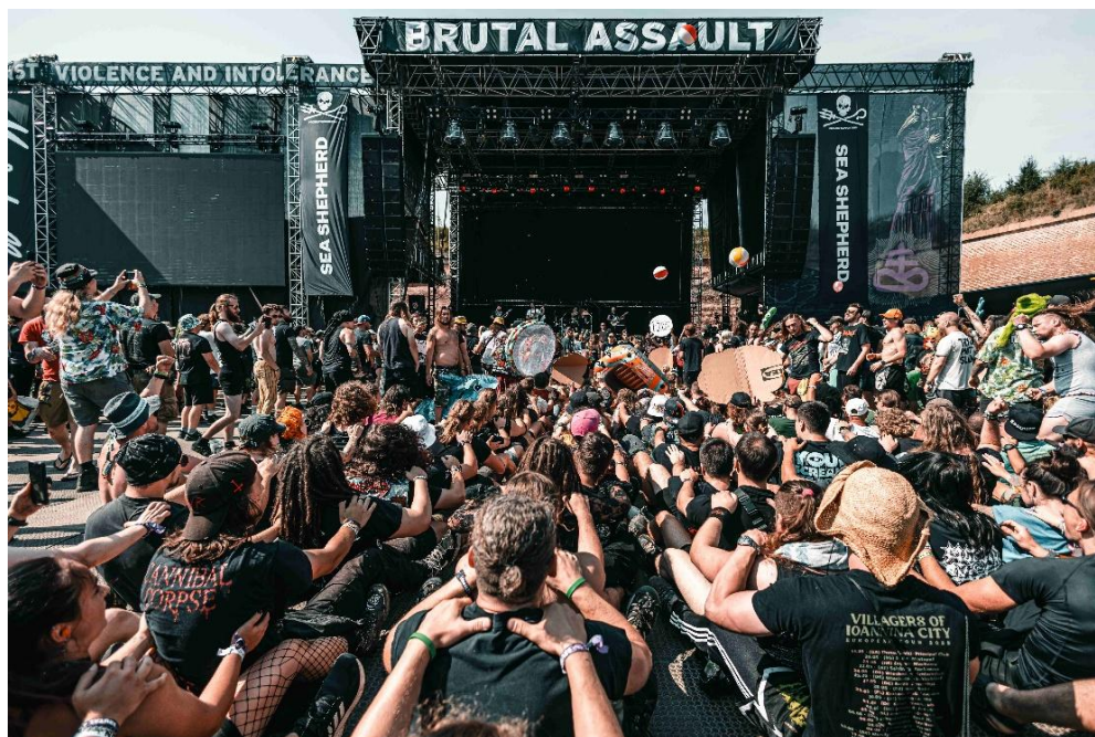
Festival BRUTAL ASSAULT