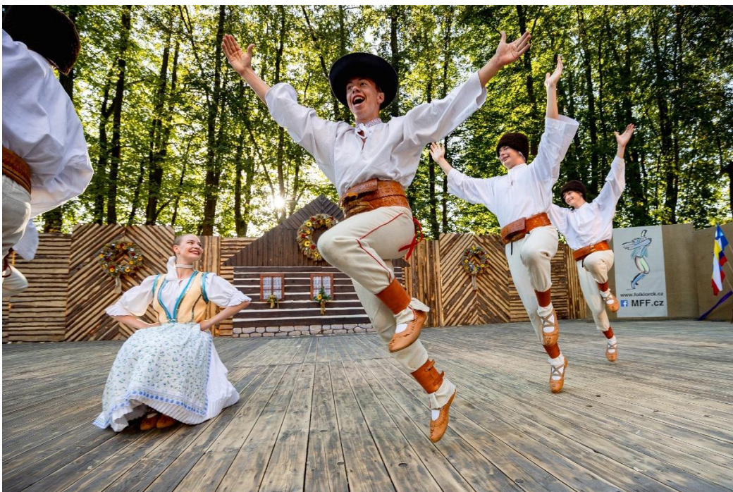
MFF Červený Kostelec