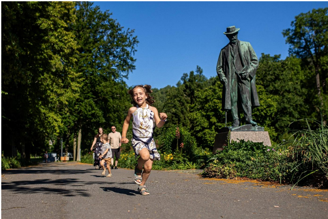
Jiráskův park Hronov