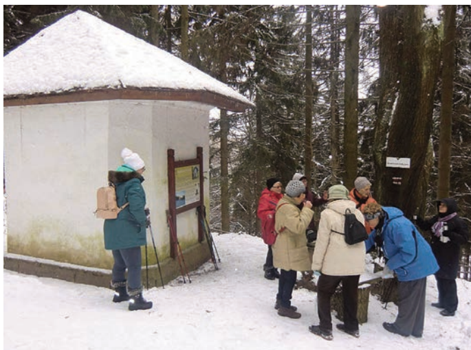
Zastavení u Kapličky v Petrovicích