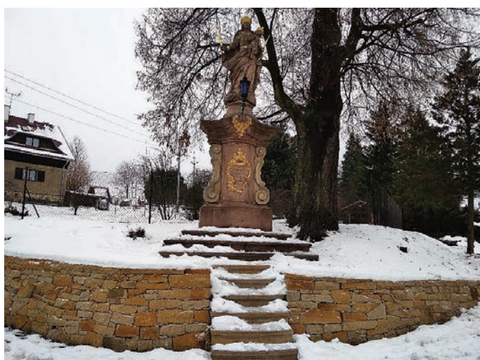
Zrestaurovaná socha Panny Marie

Restaurátorské práce na soše Panny Marie jsou dokončeny. Kovaná konzola, lucerna, atributy křížků a žezel jsou již na svých místech. Barokní památka z roku 1771 je tak nyní kompletní. Pevně věřím, že jsme životnost této skvostné památky prodloužili nejméně o dalších sto let.