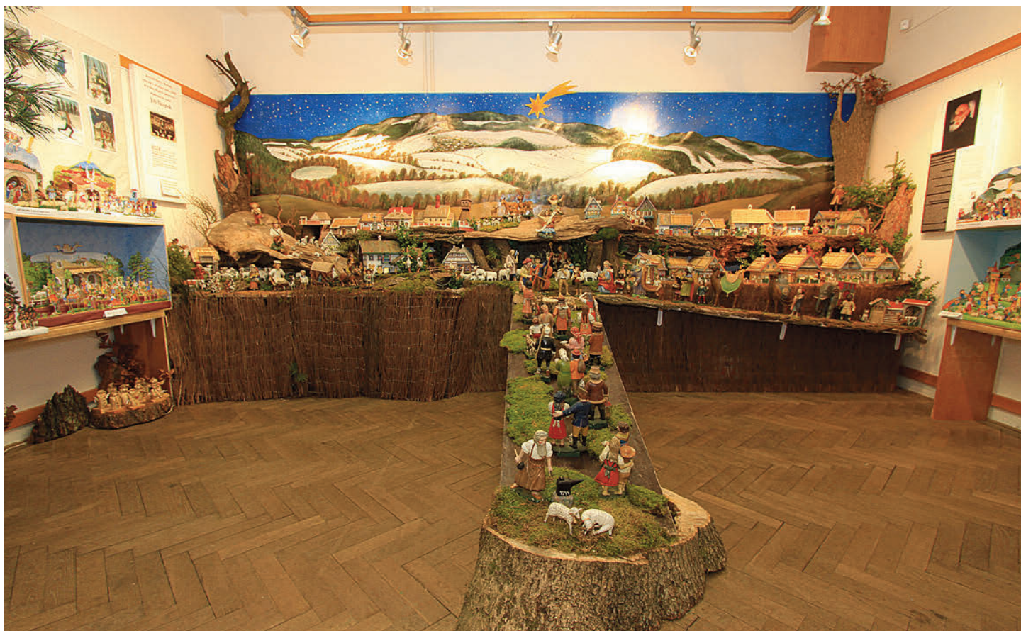
Vánoce u Studánky s Jiřím Škopkem