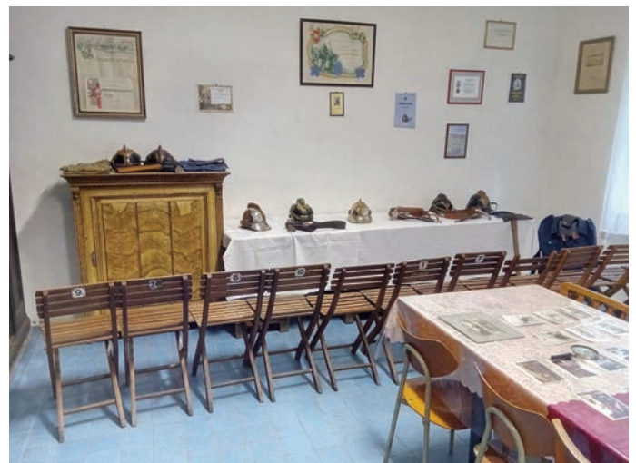
Výstava historických uniforem a hasičského náčiní

V září 2018 jsme oslavili 130 let od společného založení SDH Petrovice, Strážkovice, Odolov. Hromadné setkání pro zvané se konalo ve Velkých Svatoňovicích. SDH Odolov ještě jako připomenutí těchto dní připravil pro širokou veřejnost v panském domě čp. 35 výstavku historických fotografií, dobových uniforem a různého tehdejšího hasičského náčiní. Návštěvníci si také mohli prohlédnout různá ocenění, uznání a diplomy za dobročinnou práci hasičů Odolov. Pohoštění a zábava proběhly na louce ve stanu před panským domem. I přes velkou nepřízeň počasí byla účast hojná.