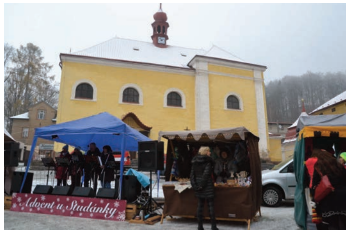
Z průběhu vystoupení skupiny H-kvintet z Trutnova