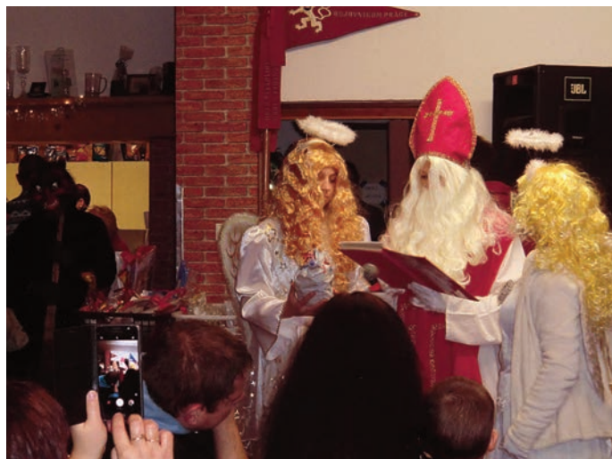
Mikulášská nadílka v Pastoušce

Mikulášská nadílka v Petrovicích je již letitou tradicí. Uspořádali jsme ji i 9. 12. 2018, a to i přesto, že ve vsi je dětí, co by na rukou spočítal. O to více nás překvapil zájem místních, ale také návštěvníků z blízkého okolí. Pastouška se zaplnila do posledního místa. Do příchodu nebeské trojice měly děti možnost zabavit se hrami, skotačením u hudby, ale také návštěvou „pekla“, které bylo nápaditě vytvořeno v přístřešku. Zde měla pětice čertů příbytek vyzdobený čertovskými obrázky, v koutě „hřál“ oheň a stůl byl zaplněn metlami z bře-