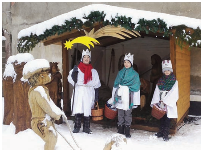
Koledníci tříkrálové sbírky

Svátek Tří králů se slaví 6. ledna. K tomuto dni se od nepaměti váže i koledování. Zaslouhou dobrovolníků a charitativních organizací se tento zvyk vrátil do novodobé historie v podobě koledování a vybírání finančních prostředků pro nemocné, lidi v nouzi a podobně. Už 18 let se i naše obec zapojuje do Tříkrálového koledování. V našem regionu je tato pomoc určena především na nákup pomůcek a zajištění potřebného materiálu pro Hospic Anežky České v Červeném Kostelci.