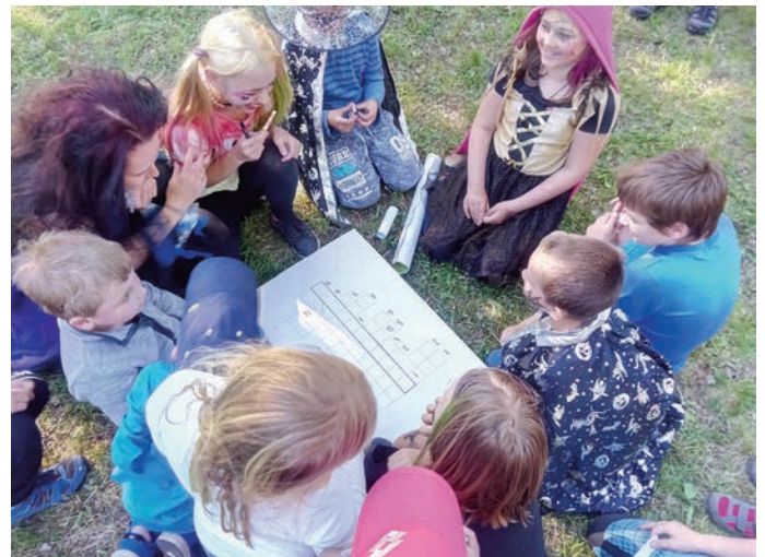
Čarodějnice a dětský den v Odolově

SDH Odolov začátkem května 2018 připravilo pálení čarodějnic spojené s dětským dnem. Děti se zabavily různými kvízy a soutěži. I v tak malé části naší obce, v Odolově, se slétli čarodějové a čarodějnice různého věku a svatojanská noc mohla začít. Opékaly se buřty, popíjel se pěňivý mok a sešli se sousedé z celého Odolova.