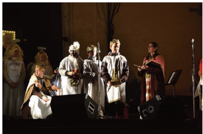
Z vystoupení Živého betlému