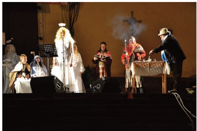
Z vystoupení Živého betlému