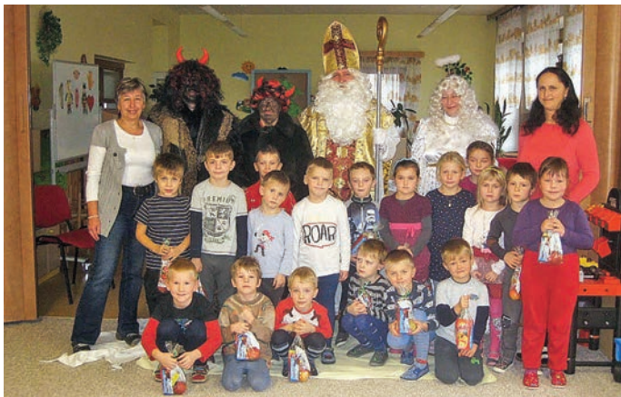
Mikulášská nadílka II. oddělení