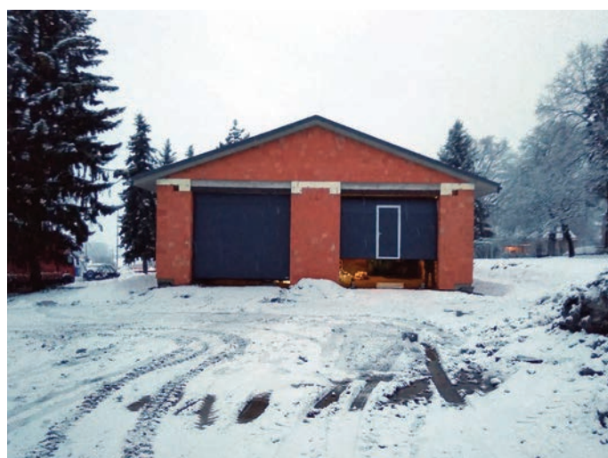
Budova pro technické zázemí

V první polovině ledna se podařilo osadit budovu technického zázemí obce novými sekvenčními vraty. Díky tomu je budova zcela uzavřena. Tím byla dokončena druhá fáze výstavby. V současné době připravujeme žádost o dotaci na dostavbu technického zázemí z programu MMR na rekonstrukce a přestavby veřejných budov. V letošním roce bychom rádi tuto budovu dostavěli.