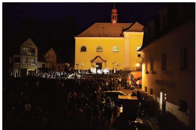
Z vystoupení Živého betlému