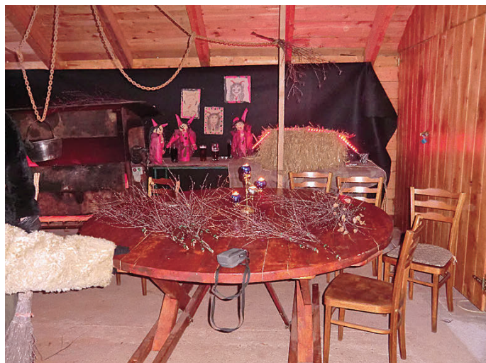
Čertovská domácnost v Petrovicích