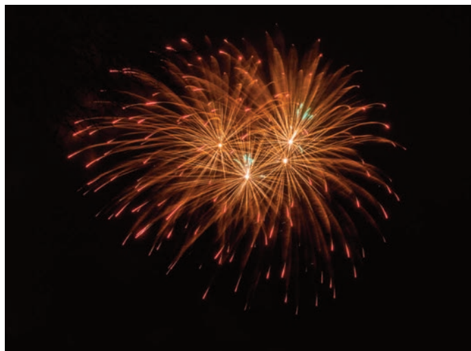
Ohňostroj na uvítání nového roku 2019