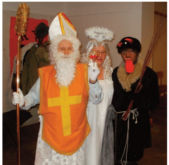
Mikulášská zábava 2018