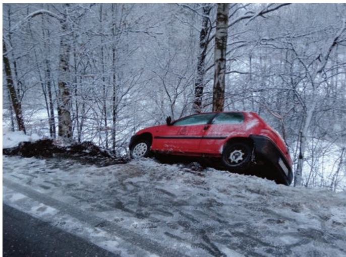
Vyproštění osobního automobilu