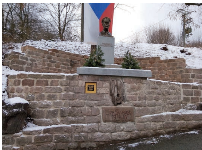
Odhalená busta T. G. Masaryka ve Strážkovicích