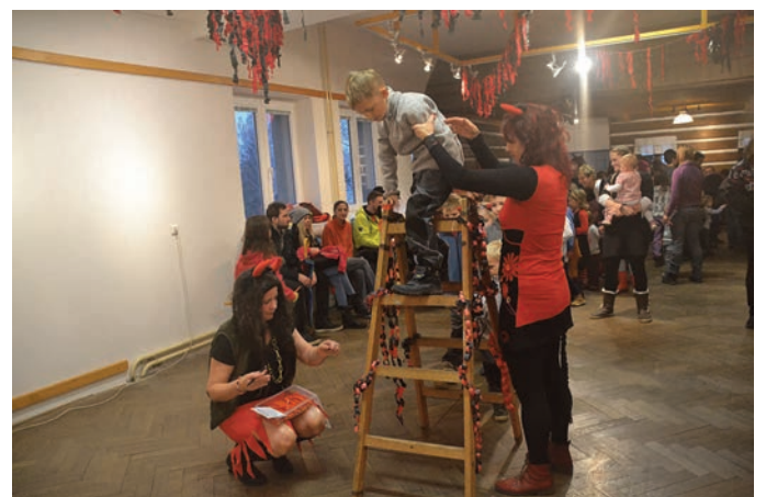
Čertovský rej si děti oblíbily