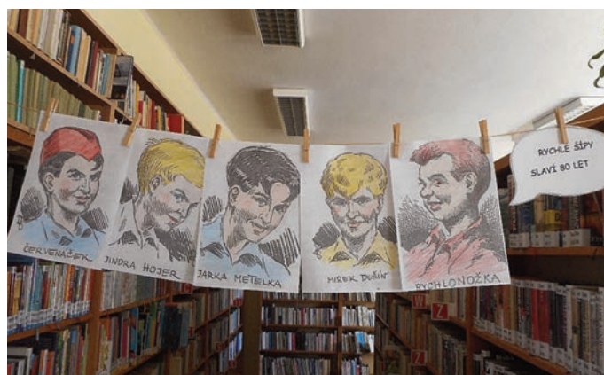
Výstava k 80. výročí Rychlých šípů autor Hana Kozúbková

Výsledky KNIHOMOLA 2018 (kolik kdo z dětí přečetl knih a časopisů):