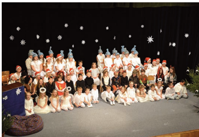
Zahájení Vánoční výstavy vystoupení dětí z I. stupně ZŠ autor Jaroslav Prokop