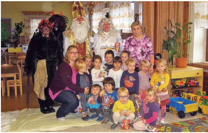
Mikulášská nadílka I. oddělení