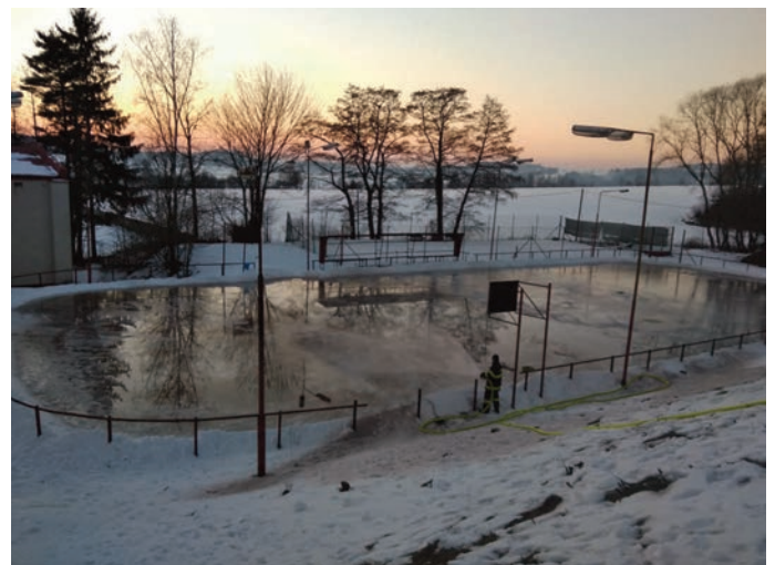
Příprava ledové plochy

V letošním roce jsme pro vás za mrazivého počasí připravili ledovou plochu na místním kluzišti v areálu BPA, ale z důvodu oblevy led dlouho nevydržel. I přesto jsme zaznamenali vysokou návštěvnost.