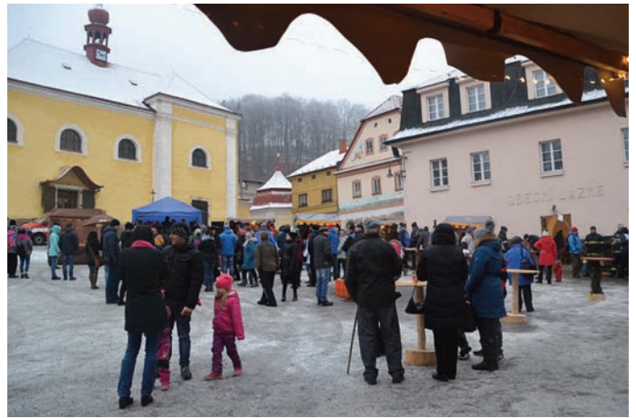
Adventní jarmark v plném proudu

Třetí adventní neděle patřila slavnostnímu zahájení vánoční výstavy Vánoce u Studánky, která je stále více navštěvovaná.