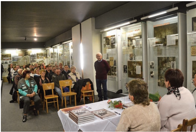
Z průběhu besedy ke knize

ného Kostelce, která za války ukrývala radistu Jiřího Potůčka z výsadku Silver A, za což byli popraveni rodiče, dědeček s babičkou a teta se strýcem.