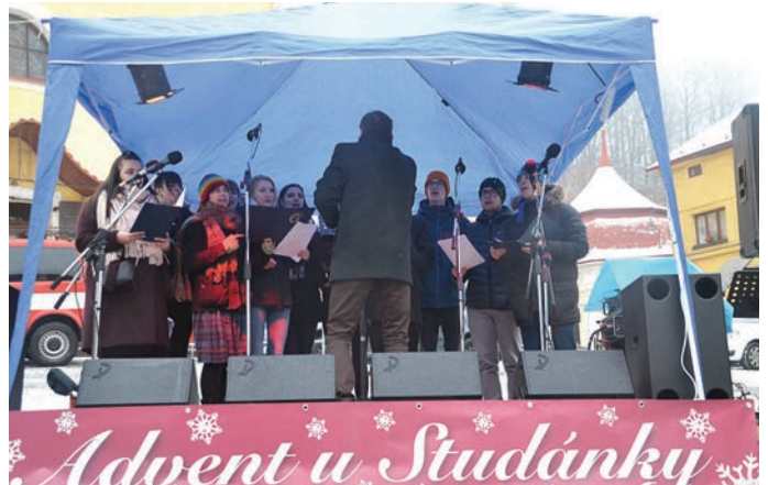
Vystoupení pěveckého sboru z Gymnázia Trutnov