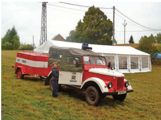
Ukázka hasičské techniky v Odolově