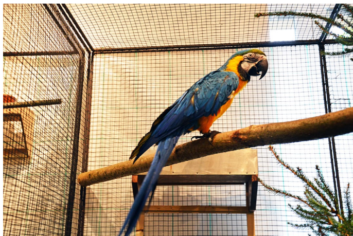
Nejvzácnější vystavovaný papoušek Ara Ararauna