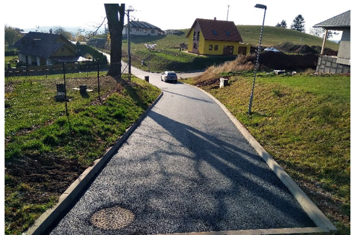
Pohled na komunikaci

Na začátku listopadu byla provedena pokládka asfaltových povrchů na místní komunikaci na Klůčku. Tím byla dovršena akce pod názvem Malé Svatoňovice – Klůček, Infrastruktura pro 8 RD. V současné době jsme požádali o kolaudaci této komunikace společně s dešťovou kanalizací. Jsem rád, že se nám podařilo celou akci dokončit. Při této akci byl opraven i povrch křižovatky, která navazuje na tuto komunikaci. V kři-