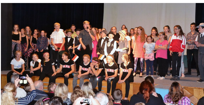
Závěrečné děkování učinkujících ve školní akademii