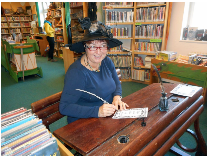
Z knihovnického kurzu