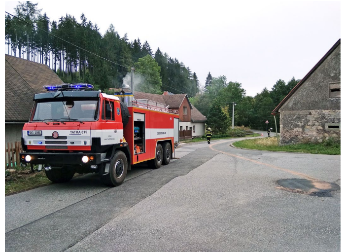
Olejová skvrna Markoušovice

Dne 22. 9. 2018 vyjela jednotka na likvidaci olejových skvrn do Markoušovic. Jednalo se o dvě skvrny velikosti cca 1x1m. Jednotka uniklé látky zasypala sorbentem. Výjezd CAS 32 - T815