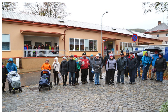
I přes nepřízeň počasí bylo na oslavách 100 let přes šedesát zúčastněných

Vernisáž této výstavy se však stala unikátem pro celý kraj. Z důvodu nepříznivého počasí byl v obci, a tedy také v muzeu, výpadek elektrického proudu. Za improvizovaného osvětlení vlastními mobilními telefony a několika baterkami bylo zahájení výstavy nezapomenutelným zážitkem pro každého. Autorky výstavy byly atmosférou nadšené. Spontánně proběhla autogramiáda publikací, které sloužily k popisu portrétů. Tím jsme příjemně naplnili čas bez dodávky proudu. Podle našich zpráv autorky toto zahájení nyní prezentují při svých rozhovorech a ko-