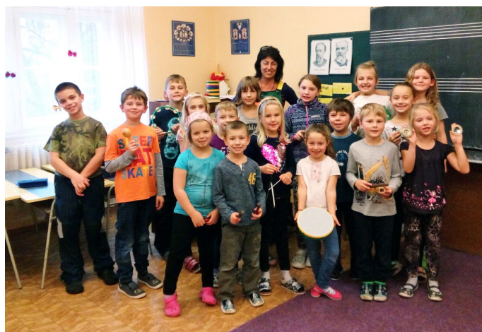
Skupina žáků s doprovodnými nástroji