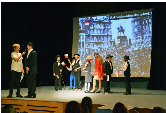
Z programu školní akademie

Wikipedie (alias Wikina, jak jí důvěrně říkáme my, kteří s ní úzce spolupracujeme) tvrdí, že akademie je původně označení antické filosofické školy, ale kromě toho může označovat slavnost s programem uměleckého rázu. A myslím si, že naše školní akademie tuto definici naprosto splnila. Slavnostní byla – však sté výročí založení republiky si to zaslouží – o to se postarala Rakousko-uherská televize, která během produkce prošla transformací na Československou televizi. Díky ní jsme mohli v přímém přenosu sledovat vyhlášení republiky v Praze a rozhovory s Masarykem, Rašínem a Benešem. Televizní vstupy doplňovala vysoce umělecká čísla žáků naší školy, ať již šlo o divadlo nebo o tanec.