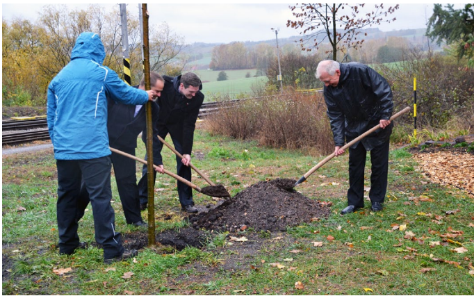
Starosta a místostarosta obce s panem farářem se ujali zasazení stromu republiky jako první

mentářích k výstavě a atmosféru na této vernisáži považují za dosud nejpůsobivější. Také velmi ocenily výzdobu obce vlajkami a tematickými bannery s T.G. Masarykem.