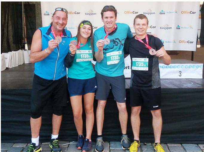
Členové SDH na Hradeckém půlmaratonu

Dne 7. 10. 2018 se někteří členové SDH Malé Svatoňovice zúčastnili štafety na Hradeckém Olfincar půlmaratonu.