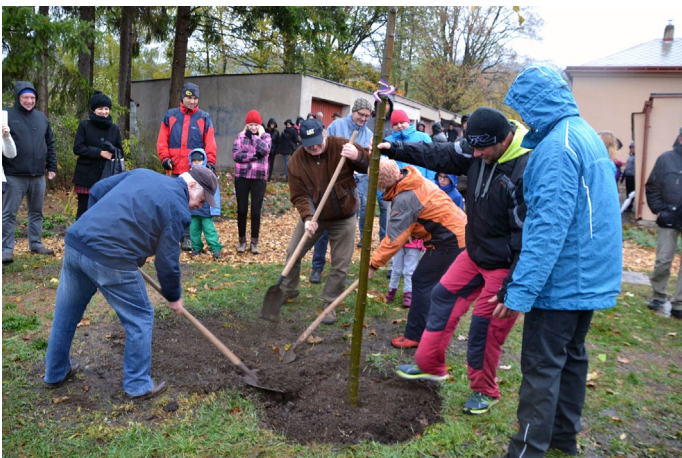
Na zasazení stromu republiky se podíleli také místní občané

Nově jsme také umístili vlajky na stožáry před obecním úřadem. Jejich vyvěšení splňuje platné požadavky, které upravuje zákon o vzhledu vlajky č. 3/1993 Sb., o státních symbolech České republiky a většinu pravidel dále upravuje zákon 352/2001 Sb. ze dne 18. září 2001 o užívání státních symbolů České republiky. Při tomto svislém zavěšení jsme dostali pravidla