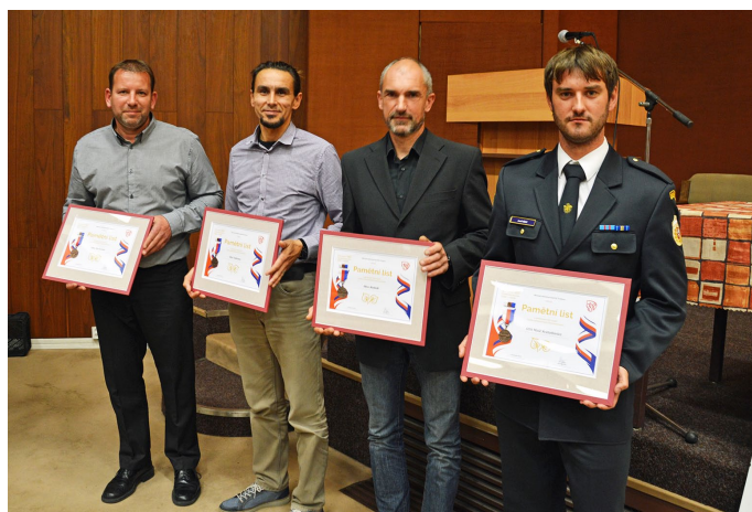
Předání Pamětní medaile Sdružení hasičů Čech Moravy a Slezska ke 100. výročí vzniku Československa

Na jednání byli přizváni zástupci měst a obcí, jejichž zastupitelstva výrazně podporují dobrovolné hasiče ve sborech i v zásahových jednotkách sboru dobrovolných hasičů měst a obcí. Představitelé a zástupci obcí a měst Trutnova, Dvora Králové nad Labem, Žacléře, Rtyně v Podkrkonoší, Černého Dolu, Mladých Buků, Havlovic, Dubence, Rudníku a Malých