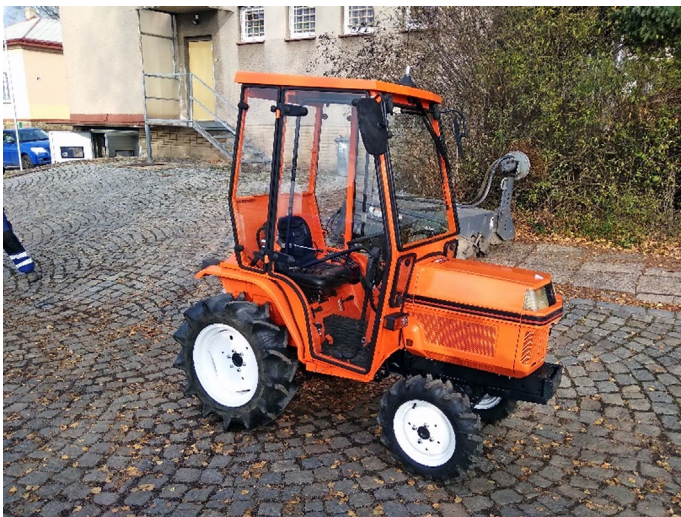
Malotraktor Kubota B1-15

Nově byly zakoupeny i GPS moduly pro sledování pohybu traktorů starajících se o údržbu komunikací v zimním období. Díky tomuto zařízení budeme mít přehled o úklidu sněhu a aplikaci posypových mate-