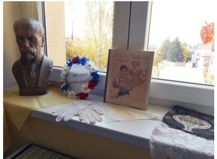
K výstavě „1. republika v knihovně“ Autor: Hana Kozúbková