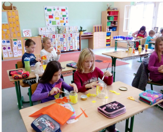
Příprava světlílek a lampionů

Náš každoroční dvoudenní projekt (8. až 9. listopadu 2018) o strašidlech s nocováním ve škole se dětem z 1. až 4. třídy opět vydařil. Děti si připravovaly světlíka-lampionky na večerní procházku Malými Svatoňovicemi spojenou s prohlídkou výstavy vyřezávaných dýní u budovy II. stupně naší školy. Dobře se bavily i při výrobě strašidýlek, skřítků, domečků pro