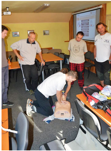
Školení na záchranu osob za pomoci AED

Členové výjezdové jednotky se dne 6. 10. 2018 zúčastnili školení, které bylo zaměřeno na resuscitaci osob za pomoci automatizovaného externího defibrilátoru (AED) v naší hasičské zbrojnici. Celou tuto ukázkou měl na starost příslušník zdravotnické záchranné služby Královéhradeckého kraje.