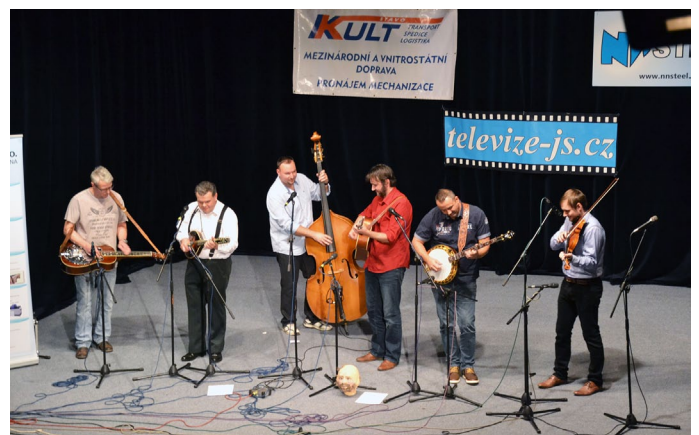
Ze sobotního koncertu lektorů