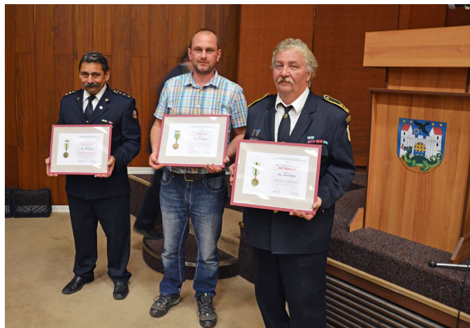
Z předávání Medaile Svatého Floriána