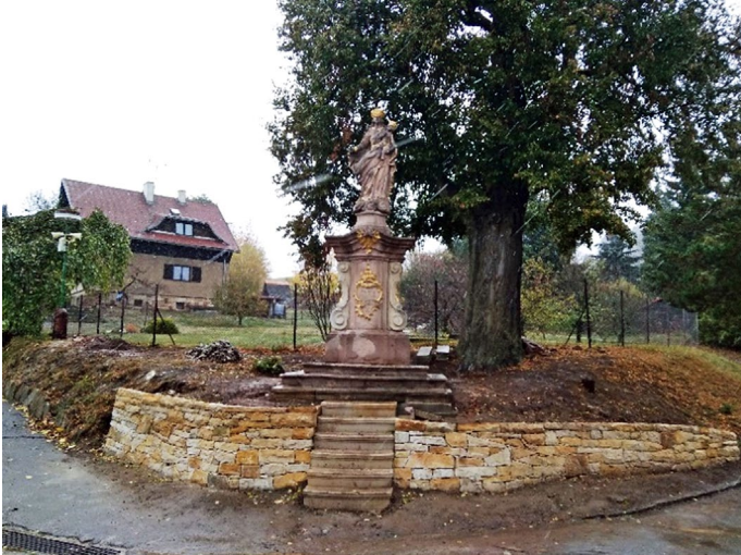
Zrestaurovaná socha Panny Marie

Restaurátorské práce na soše Panny Marie na Klůčku jsou ve své poslední fázi. Opěrná zeď je kompletně hotová včetně nového schodiště. Celá socha je usazena na svém místě. Probíhá ještě zlacení některých částí, spárování a úprava terénu. Do konce listopadu budou osazeny i nové kovové atributy.