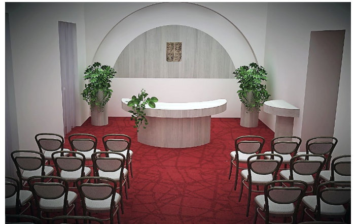
Grafický návrh obřadní síně