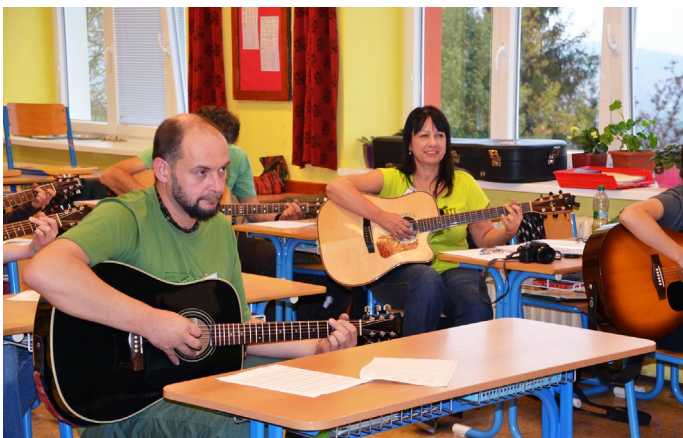
Z průběhu BG dílny