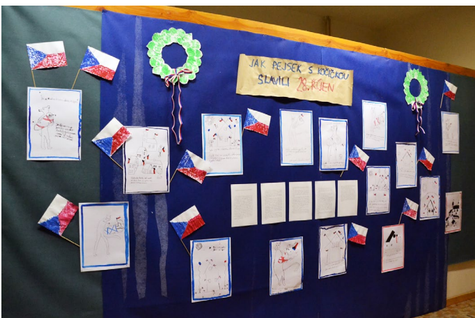
Na výzdobě k oslavám 100 let republiky se také podíleli žáci z naší ZŠ

dlům a vlajka je zavěšena modrým klínem nahoře, bílým pruhem vlevo a červeným pruhem vpravo! Toto je vždy jediné a správné svislé zavěšení státní vlajky pohledem zpredu.