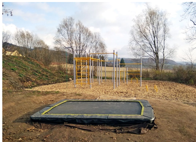
Trampolína u hřiště

Během letních prázdnin bylo hřiště na Street Workout doplněno o přízemní trampolínu o velikosti cca 2,5 x 3,5m. Tuto trampolínu v hodnotě 10 390 Kč vč. DPH věnovali dětem (obci) manželé Kultovi. Tímto bych jim chtěl velice poděkovat. Vážím si Vašeho počínu, který je u nás výjimečný. Děti jsou touto trampolínou nadšené a hojně ji využívají.