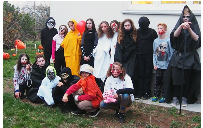
Organizátoři přehlídky dýní