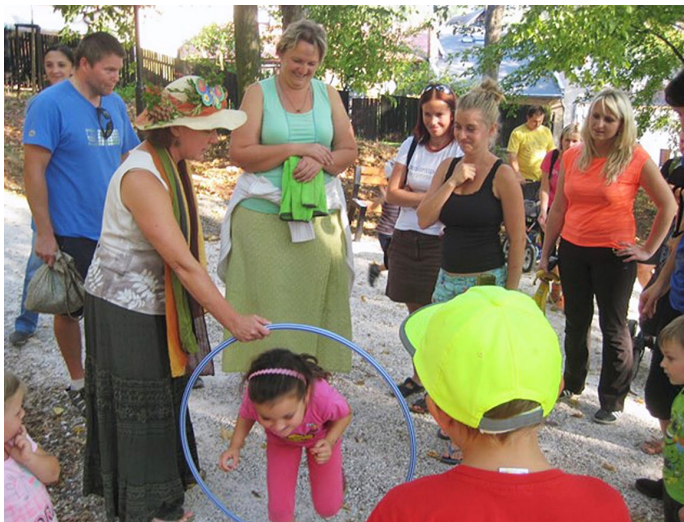
Akce ve školce

Školní rok jsme zahájili zábavným dopolednem a přivítali tak nové kamarády. Postupně se nové děti seznamují s režimem v naší MŠ a s různými akcemi, kterých se účastníme. Jednou z nich byla velice pěkná výstava Čapkova zahrádka, na kterou nás pozvali zahrádkáři z Malých Svatoňovic.