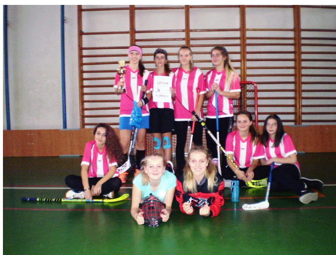
Florbalový tým starších dívek