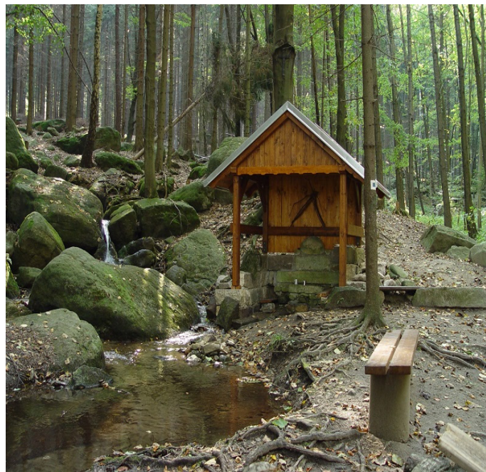
Studánka pod Borem

nad Metují, která na podzim ožije filmem i divadlem. V období od 9. 10. do 6. 11. 2018 proběhnou v polickém kině projekce všech snímků z projektu Filmové osmičky. Na podzim nás čekají také již 71. Polické divadelní hry, kde nebudou chybět vystoupení amatérských i profesionálních divadelních souborů. Jednotlivá představení festivalu se odehrají v období od 19. 10. 2018 do 9. 12. 2018. V poslední den se diváci mohou těšit na komedii 4 sestry Patrika