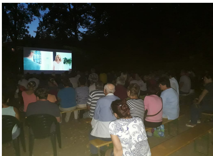
Z promítání filmu Bezva ženská na krku

Revitalizovaný park u náměstí Karla Čapka v naší obci postupně ožívá. Během prázdnin se nám podařilo uskutečnit promítání letního kina, a to hned dvakrát. Jako první jsme promítli českou komedii s Ondřejem Vetchým Bezva ženská na krku . Akce měla velký úspěch, park téměř praskal ve švech, protože přišlo přes 300 diváků.