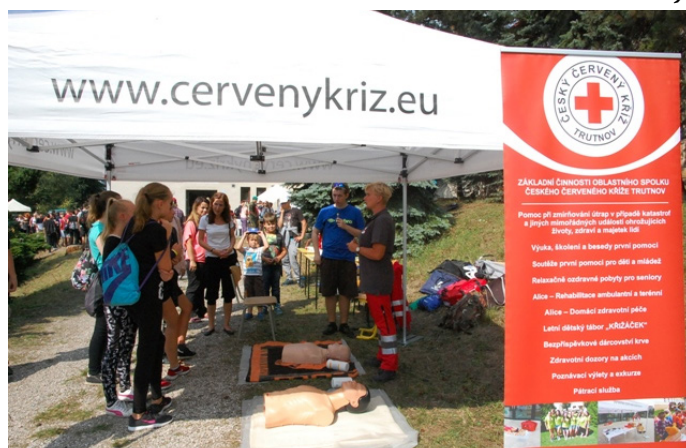
Stanoviště Červeného kříže