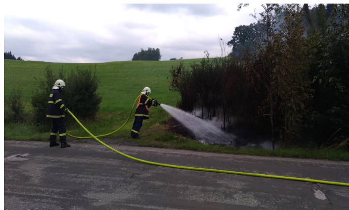
Požár hrabanky a keřů k hlavní komunikaci v Odolově