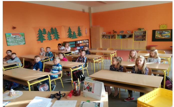
Prvňáčci ve svých lavicích