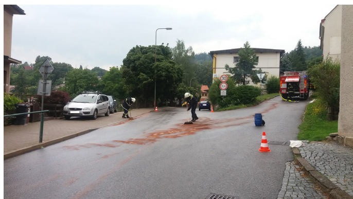
Úklid znečištěné křižovatky v Malých Svatoňovicích

Dne 20. 9. 2018 v 18:11 vyjela jednotka na likvidaci požáru travního porostu ve Velkých Svatoňovicích. Jednalo se o požár cca 5x6 m u účelové komunikace pod bývalou stělnicí. Požár byl rychle lokalizován a zlikvidován. Spolupráce s HZS PS Trutnov, JSDH Velké Svatoňovice a JSDH Úpice. Výjezd CAS 32-T815 a DA-L2Z