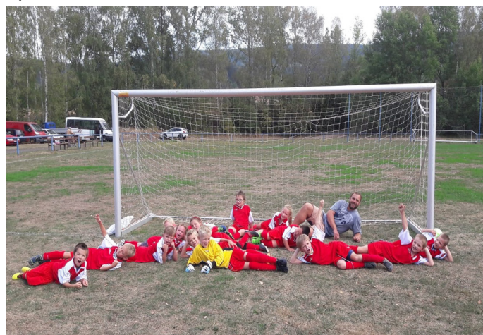
Fotbalová příprava na hřišti

TJ Sokol Malé Svatoňovice - Sokol Vítězná