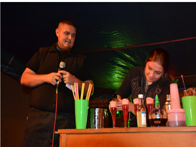
Barmanské vystoupení s ochutnávkou

Na hlavní scéně se odehrával převážně hudební program. Akci zahájili profesionální bubeníci ze skupiny Ritmo Factory, jejichž vystoupení bylo naplněno energií, temperamentem a získalo si srdce publika. Jejich krátkými vstupy jsme protkali celý