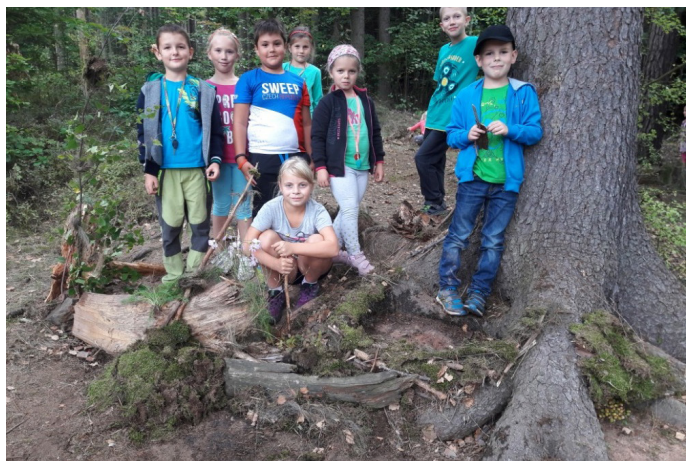
Odpoledne s družinou