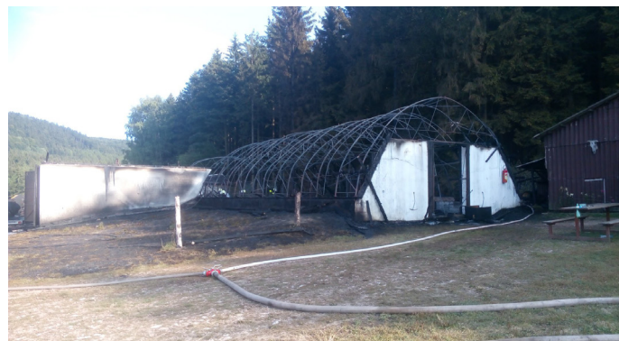
Požár stájí a uskladněného sena Janovice u Jívky

Dne 27. 8. 2018 v 14 : 59 vyjíždíme na požár stájí a uskladněného sena do Janovic u Jívky. Spolupráce s JSDH Jívka, JSDH Radvanice, PS Trutnov, PS Náchod, JSDH Adršpach, JSDH Teplice nad Metují a JSDH Police nad Metují. Dále spolupráce se ZZS Trutnov a Policií ČR.