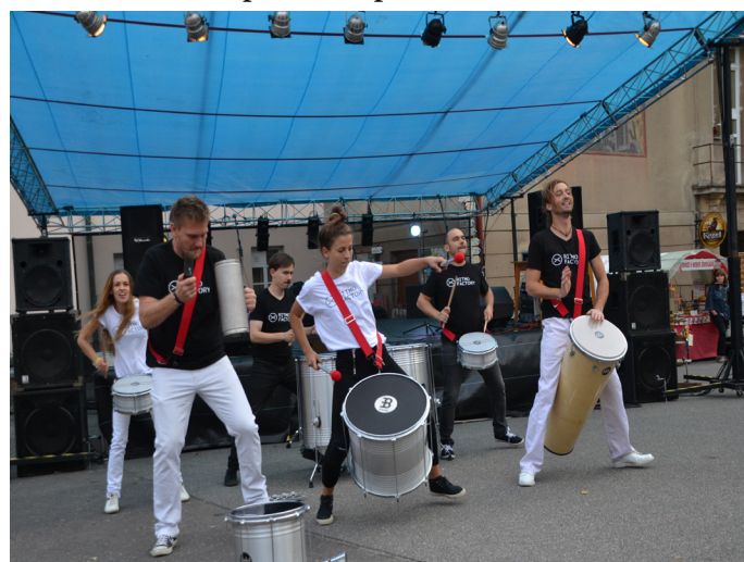
Bubeníci Ritmo factory s úžasnou energií

Dovolte nám ještě malé ohlédnutí za letními dny, a to konkrétně za poslední prázdninovou sobotou 25.