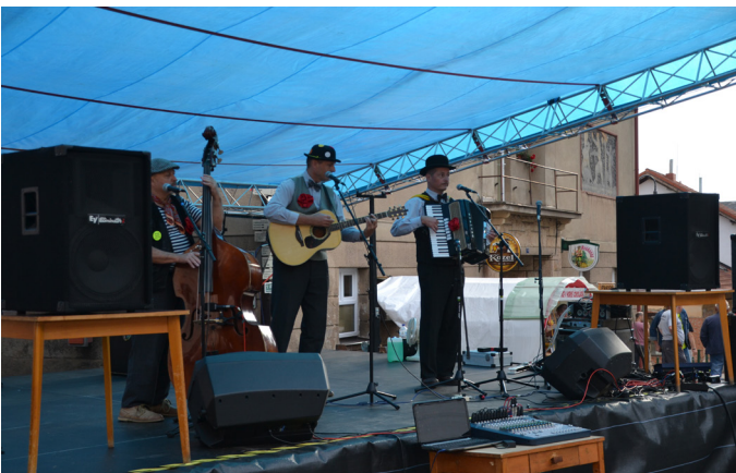
Skupina Klapeto se svými staropražskými veselými písničkami

program a tak věříme, že je nikdo z vás neminul. Následovala tematická pohádka O pejskovi a kočičce v podání divadla D21 z Prahy. Hlasitý dětský smích