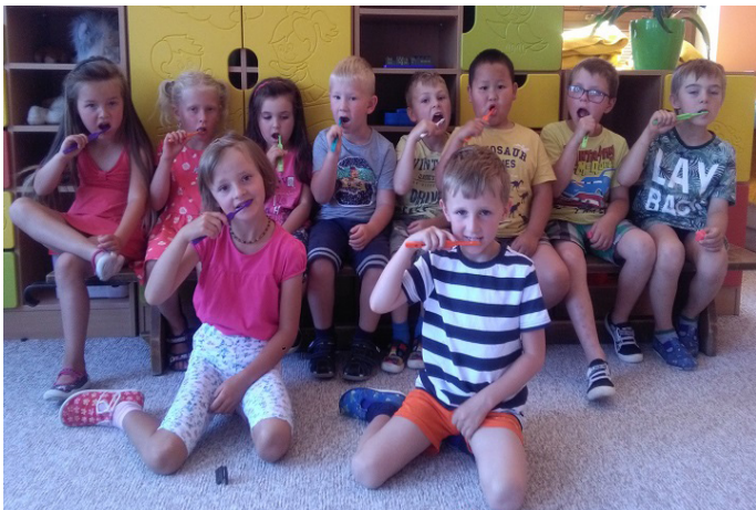
Čistíme si zoubky ve školce

Věděli jste, že podle údajů Výzkumného ústavu stomatologického mají dvanáctileté děti v ČR 2,5krát více zkažených zubů než děti ve státech jako je např. Švýcarsko nebo Finsko a Dánsko? Dětský úsměv je unikátní projekt preventivní péče o zuby dětí, který má tuto situaci změnit. Pro názornost a upoutání pozornosti dětí se používají obrázky, výukové omalovánky, kvízy, pracovní listy, modely zubů Děti pracují s pracovními sešity, které ilustroval Miloš Nesvadba.