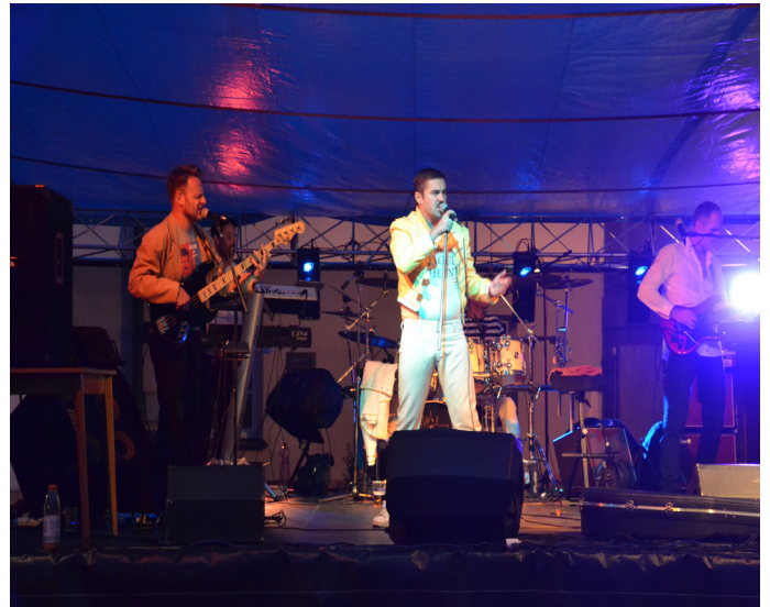
Prague Queen roztančila celé náměstí

během této pohádky byl nakažlivý a i dospělí diváci se nechali vtáhnout do děje. Poté si přišli na své milovníci pražských veselých písniček, které nám do Malých Svatoňovic přijela zahrát kapela Klapeto. Mezi jednotlivými hudebními ukázkami se mohli diváci seznámit s míchanými nápoji, které míchala studentka