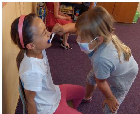
Učíme se čistit si zuby

Ve škole bylo dětí podstatně méně, ale i s tak jsme si to náležitě užili. Větší děti jsou daleko zvědavější. Každou