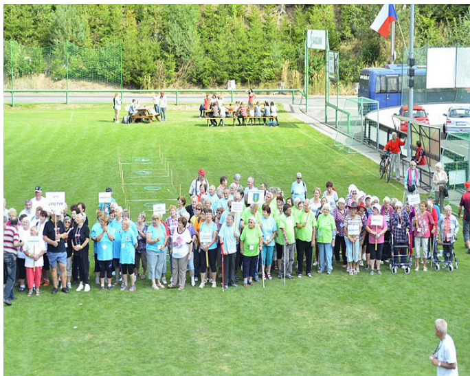
Jubilejní 10. ročník Olympiády pro starší a dříve narozené

Ve čtvrtek 6. září 2018 se Všesportovní areál v Havlovicích jako již tradičně zaplnil účastníky Olympiády pro starší a dříve narozené. Tento rok