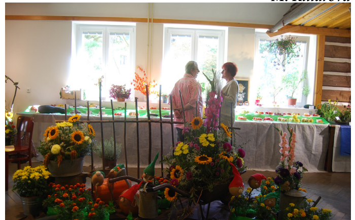
Výstava zahrádkářů opět měla co nabídnout