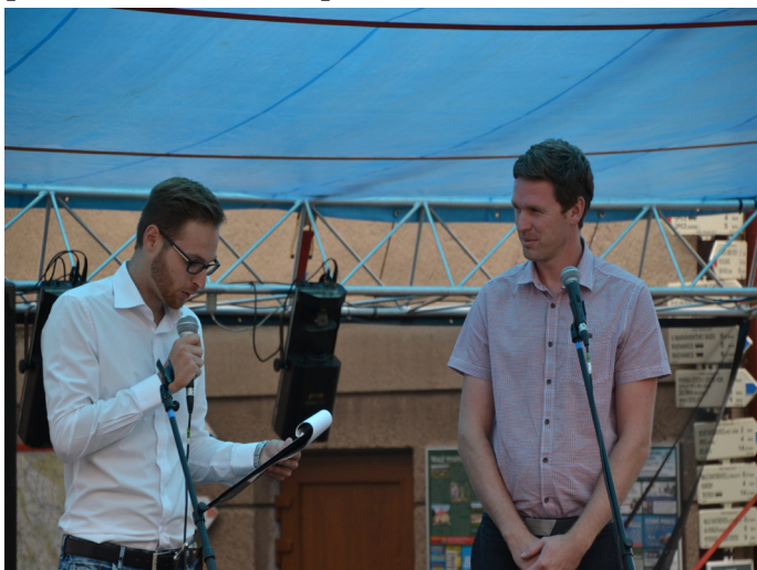
Zahájení akce Léto nekončí starostou obce

srpna, kdy se konala obecní akce s názvem LÉTO NEKONČÍ. I když celé léto bylo velmi horké, suché, srážek minimum, v noci z pátku na sobotu před akcí se zataáhlo a silný vítr a prudký déšť nás trochu vylekal. Pódium nám ale vítr neodnesl a připravený program pro malé i velké mohl proběhnout.