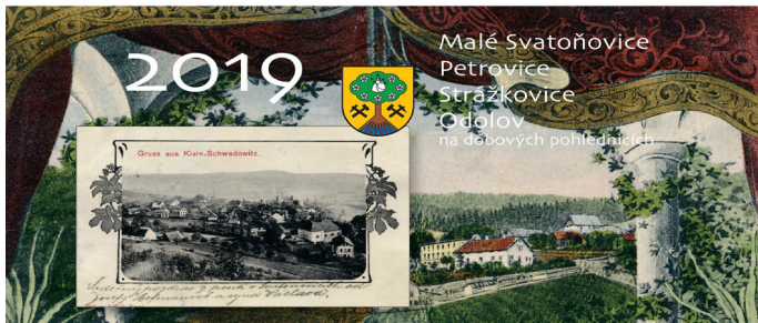
Titulní strana stolního kalendáře našich obcí pro rok 2019 autor grafického návrhu Miroslav Pavel

V loňském roce Obec Malé Svatoňovice vydala svůj první stolní kalendář obcí Malé Svatoňovice, Petrovice, Strážkovice a Odolov pro rok 2018. Historie našich obcí je bohatá a je stále z čeho vybírat, a tak Vám můžeme i pro rok 2019 přinést další zajímavé pohlednice, obrázky a fotografie z dob minulých.