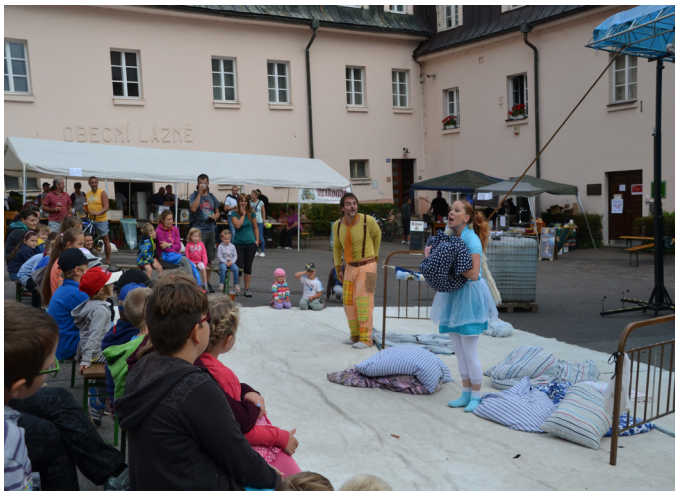
Pohádka o Pejskovi a Kočičce pobavila malé i velké diváky

a shazování z kladiny. Tato dětská scéna byla plně využita po celé odpoledne.