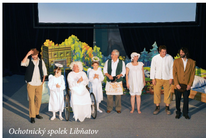
Ochotnický spolek Libňatov