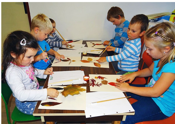
Děti v Žaltmánku tvoří, autor D. Kociánová

Jak jsme vás informovali už v minulé Studánce, herna pro děti je od října zase otevřená, a to každé pondělí od 9 do 11 hodin pro nejmenší, pro které je připravená spousta hraček a zábavy. A každé pondělí od 15 do 17 hodin