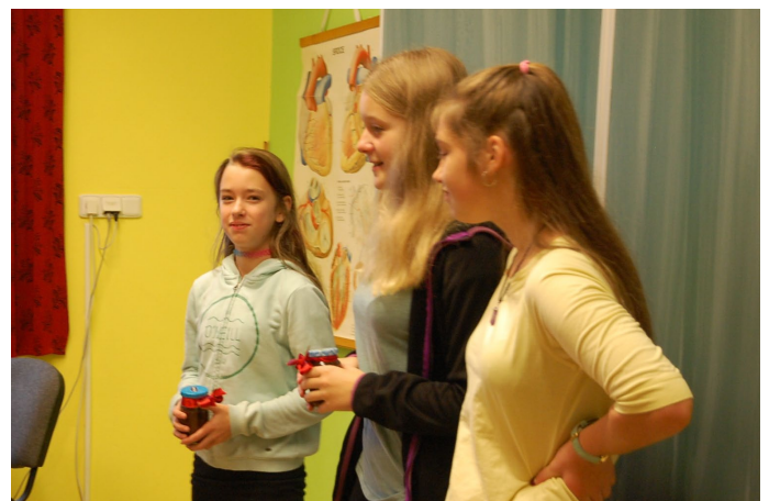
Nejlepší odměněná žákyně v soutěži, autor Eva Brátová