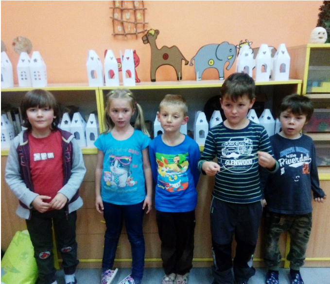
Žáci na projektu Strašidel se nebojíme , autor Alena Herzigová