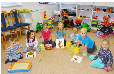
Zábava v Žaltmánku, autor D. Kociánová

Jak jsme vás informovali už v minulé Studánce, herna pro děti je od října zase otevřená, a to každé pondělí od 9 do 11 hodin pro nejmenší, pro které je připravená spousta hraček a zábavy. A každé pondělí od 15 do 17 hodin