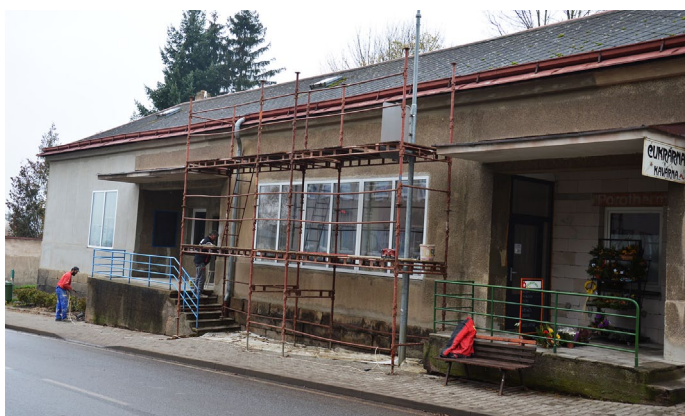
Probíhající opravy na budově

V říjnu začaly dlouho očekávané opravy na budově č. p. 125 stojící naproti obecnímu úřadu. V letošním roce bude vyspravena přední část fasády, která bude dána do lepidla a perlinky. Zima se však neúprosně blíží, a tak nebude možné dokončit celou opravu v tomto roce. Na jaře příštího roku bude oprava pokračovat nátěrem všech kovových prvků, opravou fasády v zadní části, okopáním základů a odizolováním zdiva, opravou podezdívek z kamene, výměnou schodišť a dlažeb, výměnou zábradlí a bezpečnostních mříží a nakonec natažením nové fasády. Předpokládaný termín pro dokončení je květen 2018.