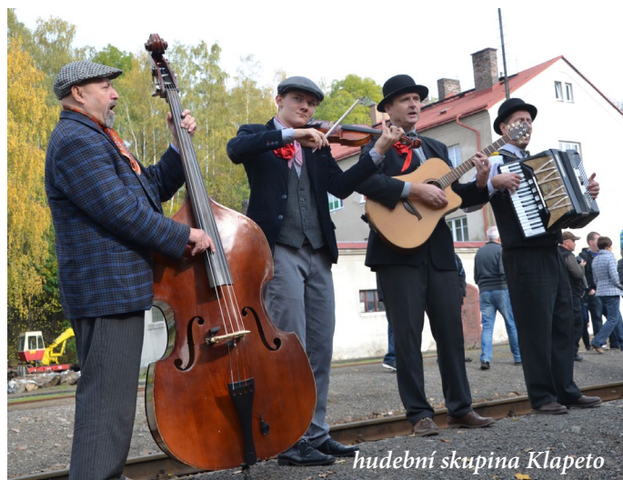
hudební skupina Klapeto