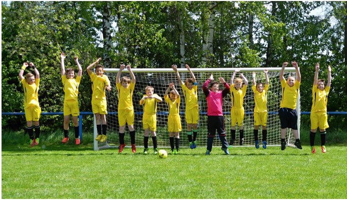
Tým mladších žáků Malé Svatoňovice