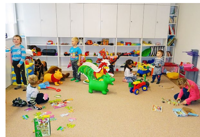
V Žaltmánku máme spoustu hraček, autor D. Kociánová

Děti tam najdou spoustu hraček, maminky si můžou dát výbornou kávu z našeho presovače, u herny je i malá kuchyňka s mikrovlnkou a sociální zařízení. Neseděte doma, přijďte si hrát!