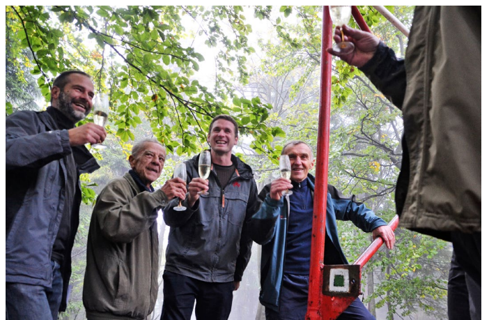
Přípitek při odhalování pamětní desky u rozhledny Žaltman