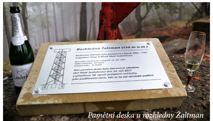
Pamětní deska u rozhledny Žaltman