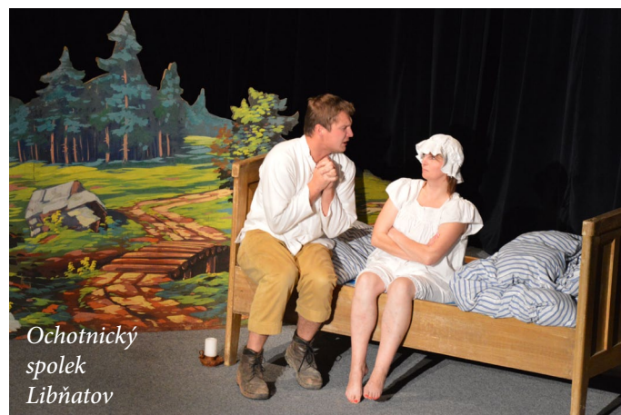
Ochotnický spolek Libňatov