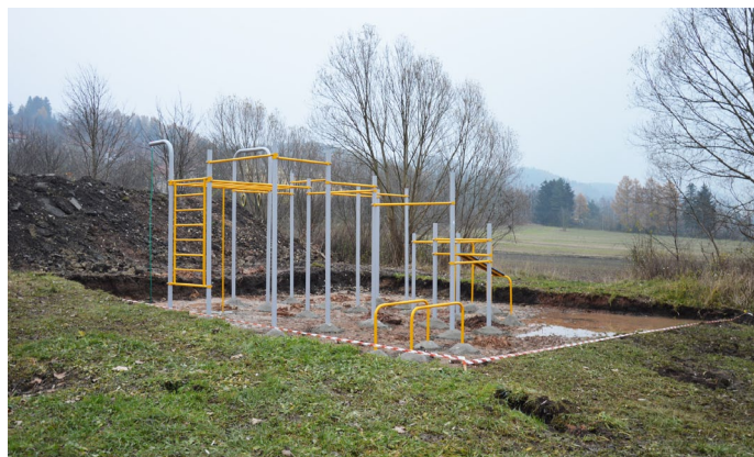
Vznikající workoutové hřiště nad sídlištěm

Projekt „Dětská hřiště a Workout sportoviště Malé Svatoňovice“, byl realizován za přispění prostředků státního rozpočtu ČR z programu Ministerstva pro místní rozvoj.