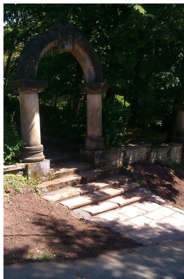
opravený vstup do Mariánského sadu

V předešlých měsících došlo k vyřezání náletových dřevin podél hlavní komunikace z Malých Svatoňovic až na Odolov. Veškeré dřeviny jsou svázeny na hromady a poté štěpkovány odbornou firmou, která hmotu odváží do teplárny v Poříčí. Na náměstí jsou nově osázeny květináče, kde byly zakomponovány i květiny. Dále probíhá intenzivní sekání trávy a úprava keřů ve všech lokalitách.