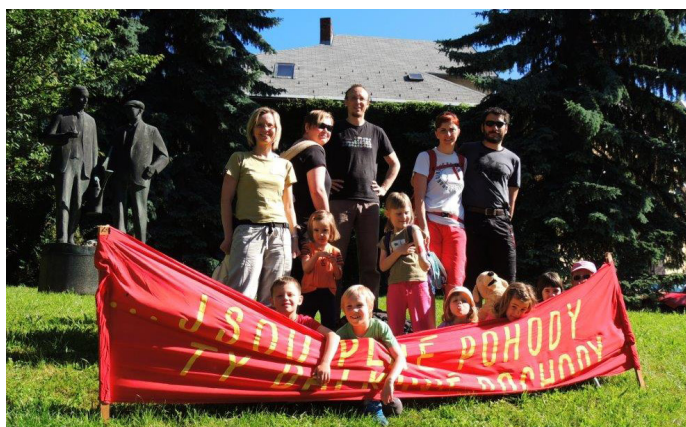
Krvavej Čepelka (autor: Stanislav Novotný)

V sobotu 6. června se v naší obci uskutečnil již 41. ročník pochodu Krvavej Čepelka – Krajem bratří Čapků. Počasí turistům přálo, pořadatelé vše vzorně připravili (popisy tras, bohatou tombolu, občerstvení, diplomy, medaile, různé informační materiály o našem regionu),