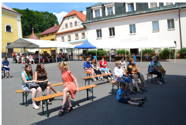
návštěvníci Čapkiany 2015

Finančně byla letošní Čapkiana pokryta z více než dvou třetin z darů partnerů. Získali jsme více než 70 tisíc korun a díky patří zejména Městu Trutnov, firmám NN STEEL s.r.o., Grund a.s. Mladé Buky, Nypro hutní prodej a.s., Juta závod 02 Úpice, Polytex Malé Svatoňovice, Kara Trutnov, Transport Trutnov, Pekárny a cukrárny Náchod, AKVA-MONT Malé Svatoňovice, prodejna Míšy Pelcové Malé Svatoňovice, SVS Malé Svatoňovice, Maratonstav Úpice, Melichar Úpice, Magnusfilm, Český rozhlas Hradec Králové.