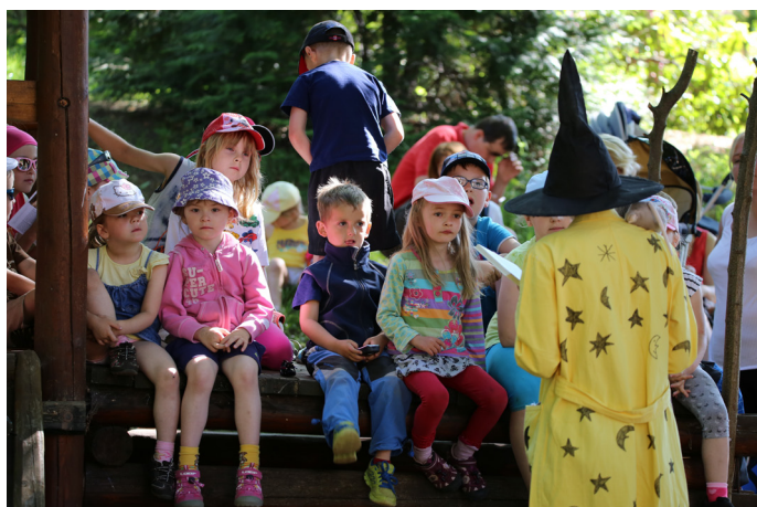
čtení Velké doktorské pohádky (autor: M. Švrčina)

První z nich, která se konala 6. 6. 2015, byla dětská trasa pochodu Krvavej Čepelka letos na motivy vyprávění K. Čapka o kouzelníku Magiášovi z Velké doktorské pohádky. Na za-