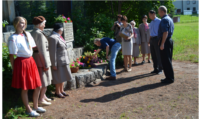
Uctění památky obětí Heydrichiády

Dne 4. 7. 2015 se konalo pietní setkání k uctění památky obětí Heydrichiády - odbojové skupiny S-21-B. Vzpomínka proběhla u památníku v areálu koupaliště v Malých Svatoňovicích za účasti Sokolské župy Podkrkonošské - Jiráskové.