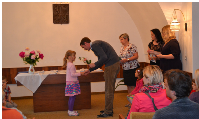
rozloučení s mateřskou školkou

Ve čtvrtek 18. 6. 2015 proběhlo v obřadní síni v Malých Svatoňovicích slavnostní rozloučení s dětmi, které