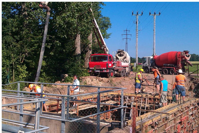
stavební práce na ČOV Jestřebec

V současné době probíhají stavební práce na nově vznikající nádrži ČOV Jestřebec. Je již hotova základová deska, svázané kovové armatury a zbudováno bednění bočních stěn. V úterý 7. 7. 2015 byl prostor mezi bedněním vylit betonem. Nyní bude následovat tvrdnutí betonu. Poté proběhne zkouška těsnosti nové nádrže. Následovat budou stavební práce kolem čistírny a příprava elektroinstalace. U technologické části byla zahájena výroba nerezových prvků. Předpokládané dokončení stavby je v posledním týdnu měsíce září.