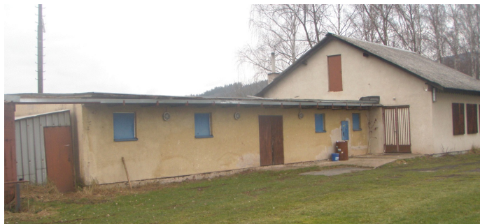
areál možno pronajmout pro vaše akce

V sezóně 2014/2015 měl malosvatoňovický fotbal ve hře tým přípravky, mladších dorostenců a mužů. Tým přípravky hrál turnaje, které nejsou zaznamenány, hráči patřili k průměru. V letošním roce se nám nedařilo uskutečnit některé turnaje z důvodu nedostatku týmů.