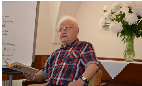
četba v obřadní síni To mám z Čapků nejraději

Pomáhali hasiči, RC Žaltmánek, dobrovolníci. Přijela velká výprava členů SBČ z Prahy, z Trutnova a z celého regionu. Jen místních bylo opravdu málo.