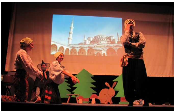
Doktorská pohádka (autor: Lucie Petráčková - 8. třída)

Bohužel se to ze začátku nevedlo. V průběhu nacvičování, po dvou měsících, některé žákyně odmítly vystupovat, a když nám odešla představitelka jedné z hlavních