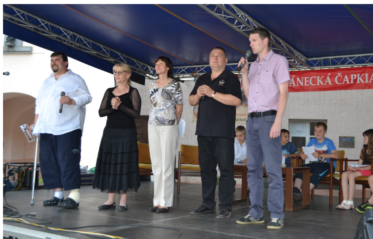
zahájení Studánecké Čapkiany 2015