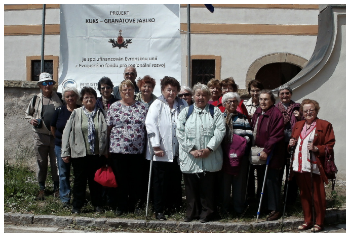
výlet do Kuksu

Dále nabízíme pronájem hřiště s veškerým zázemím, včetně stolů, lavic a stanů 3x6 a 4x10. V případě zájmu o pronájem kontaktujte p. Davida na tel.: 603 867 365.