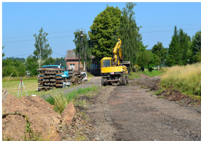
uzavřený přejezd U strážného domku Malé Svatoňovice (za koupalištěm)