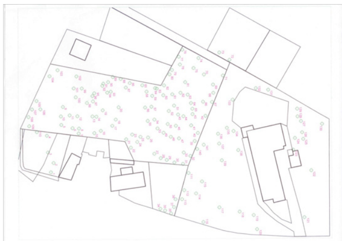
vznikající projektová dokumentace

Jelikož se množí dotazy ohledně stromů v místním parku tak musím uvést na správnou míru, jak se věci skutečně mají. Stromy, které jsou označeny tečkou, nejsou ty, které budou pokáceny, ale ty, které byly zahrnuty do řádné inventury a jsou součástí tvorby vznikající projektové dokumentace. Každá tato dřevina dostala své číslo, pod kterým se bude vyskytovat v dokumentaci. Toto bylo učiněno jako první krok připravované revitalizace a to z důvody, aby nebyly pokáceny dřeviny, které mohou být pro projekt použitelné.