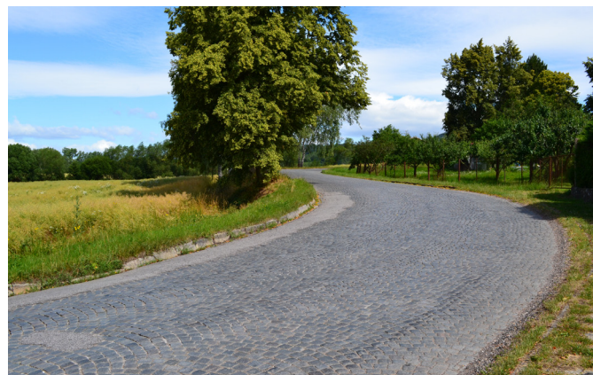
komunikace k rekonstrukci

Jak již téměř všichni víte, plánovaná rekonstrukce komunikace byla v ohrožení. Stalo se tak z důvodu podaného odvolání společnosti Polytex s.r.o. proti stavebnímu povolení. Důvodem bylo rozhodnutí úřadů provádět stavbu při úplné uzavírcce komunikace, což by znamenalo úplné odříznutí spol. Polytex od dopravní obslužnosti. Celou situaci jsem nenechal náhodě. Vložil jsem se naplno do vyjednávání podmínek pro stažení podaného odvolání. Vyvolal jsem několik jednání se SÚS, zhotovitelem i Polytexem. Podařilo se. Vytoužené „ovoce“ v podobě nové komunikace bude. Tímto Vás žádám, abyste v nadcházejících měsících byli velmi trpěliví, protože uzavírka hlavní komunikace přinese i spoustu problémů a komplikací. Aktuální informace k objízdovým trasám, uzavírkám a náhradní dopravě budou vždy na webových stránkách obce.