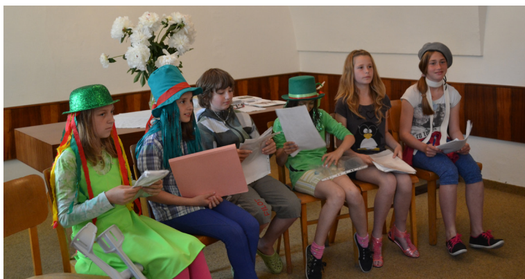
četba v obřadní síni To mám z Čapků nejraději