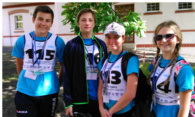
Zlatí cyklisté HK kraje

Postoupily do celostátního finále, které se konalo v Chomutově a Kadani od 16. června do 18. června 2015.