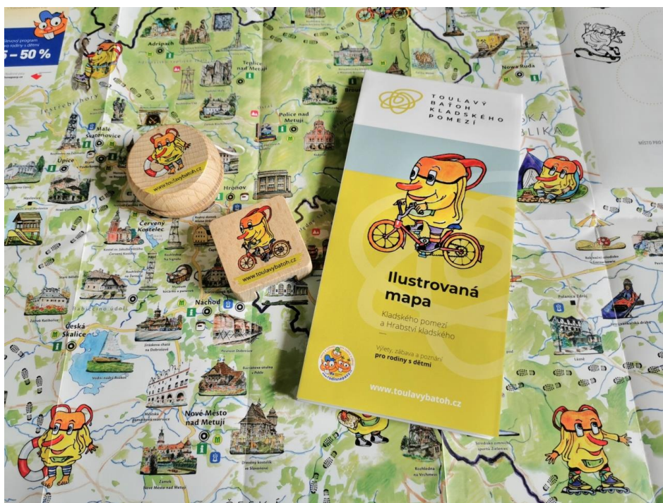
Toulavý baťoh