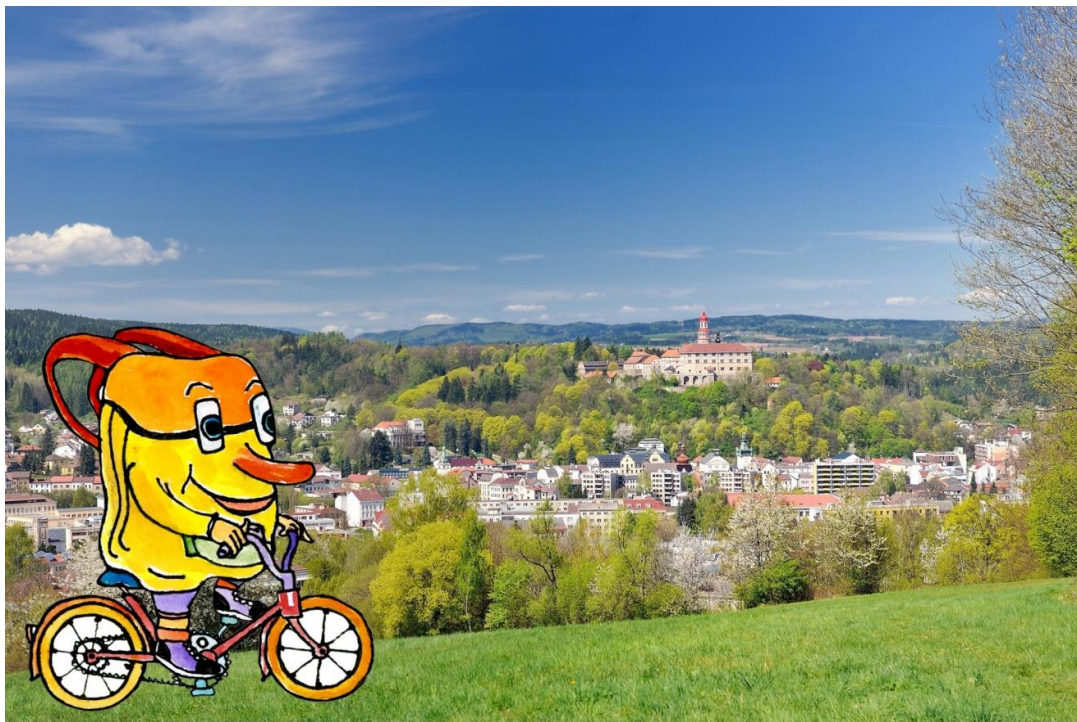
TB Náchod