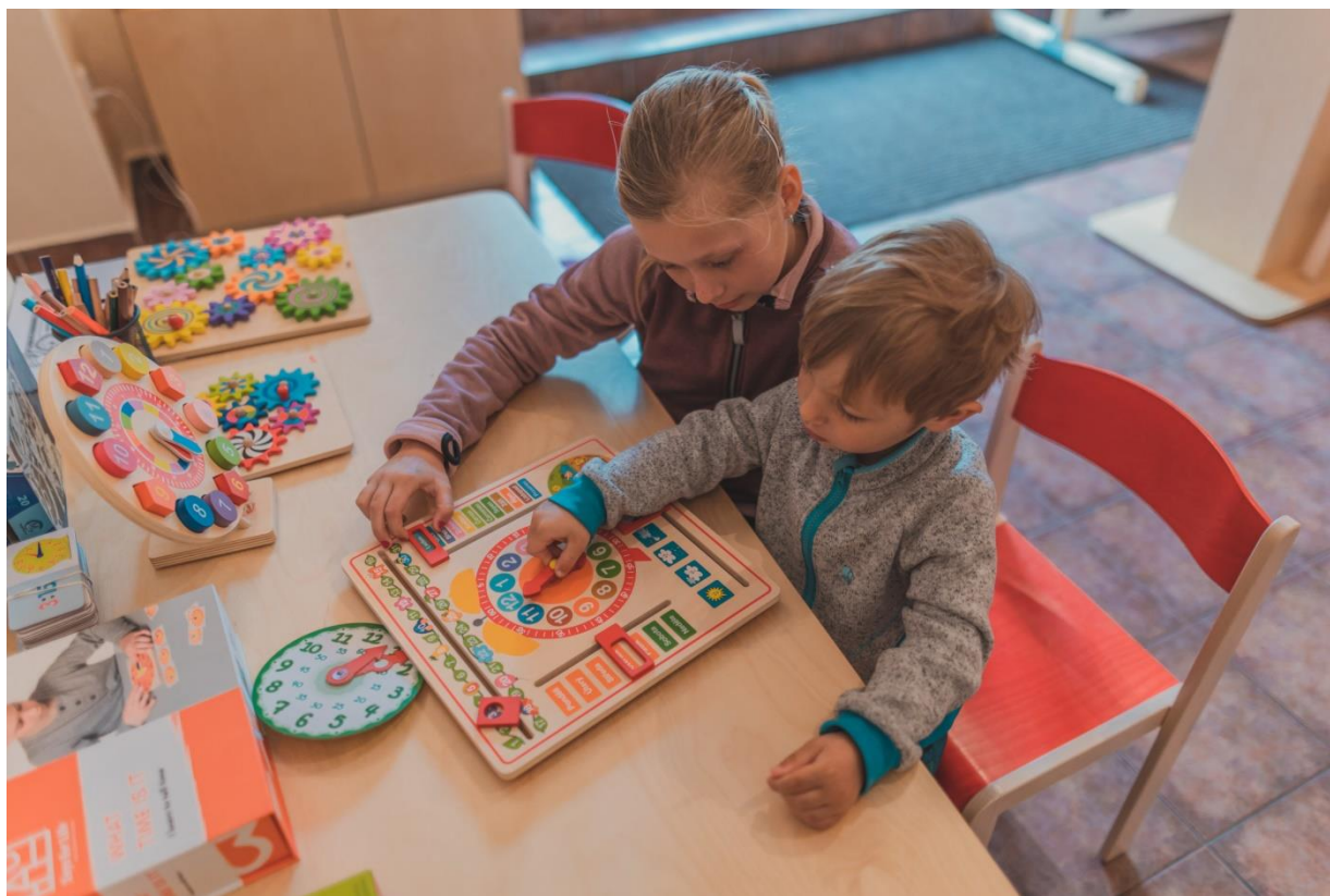
Interaktivní expozice Město hodinek