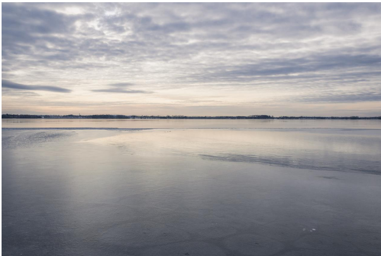
Vodní nádrž Rozkoš – autor Tomáš Menec