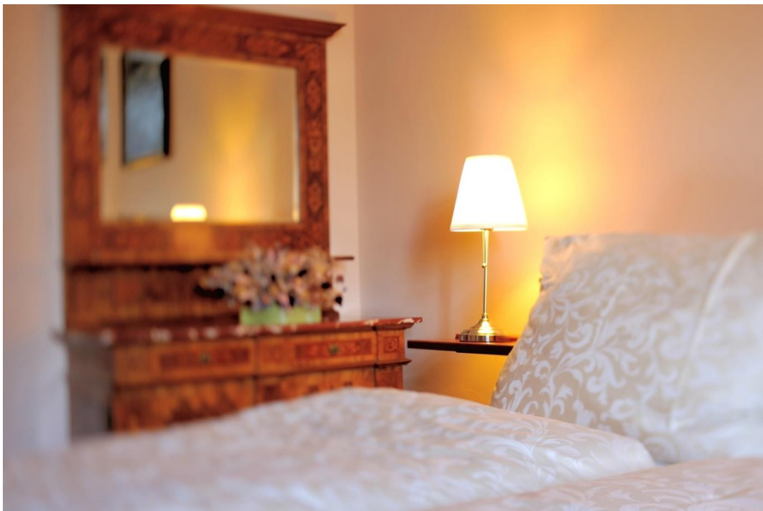
Ubytování v Kladském pomezí