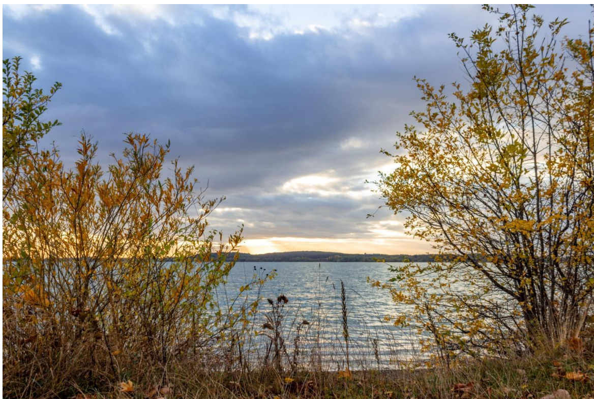
Vodní nádrž Rozkoš