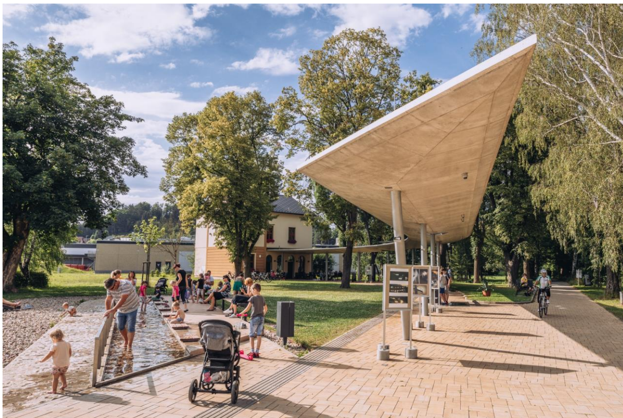
Malé lázně Běloves