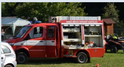
Technický automobil RZA-L1 Mercedes Benz Sprinter (SDH Červený Kostelec)