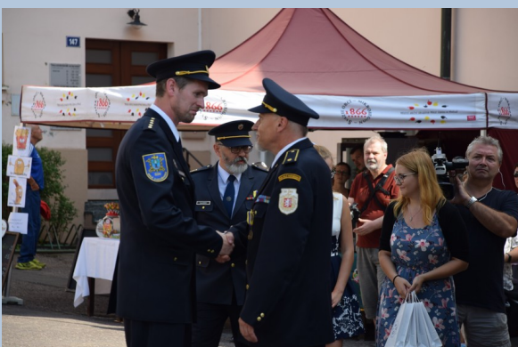
Vzájemná předání medailí a gratulace mezi starostou a velitelem sboru.