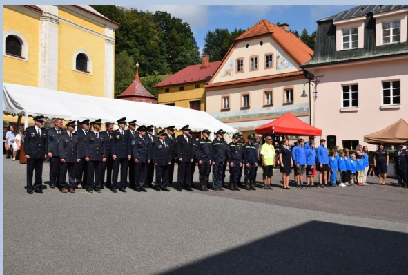
Sbor dobrovolných hasičů Malé Svatoňovice je nastoupen k zahájení ceremoniálu.