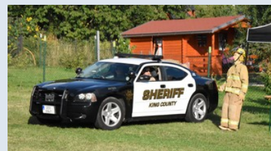
Služební vůz úřadu šerifa v King County (USA) Dodge Charger (3,5l, V6, 280HP) doplněná o figurínu v zásahovém obleku amerických hasičů. (Czech Sheriff Car)