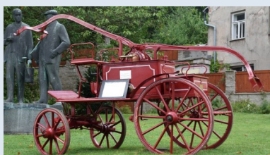
Koněspřežná ruční stříkačka výrobce Smekal z r. 1908 (SDH Velké Svatoňovice)

Další tři vozidla (jedná se o typy vozidel, která v minulosti sloužila u malosvatoňovického sboru): cist. aut. stříkačka CAS-25 Škoda 706 RTHP (firma Vavřena VAPO s.r.o.) - doprav. aut. DA-12 Avia 30 (SDH Velké Svatoňovice) - doprav. vozidlo DV-8 Tatra 805 (SDH Velké Svatoňovice).