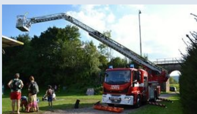
Automobilový žebřík AZ-30 M1Z Iveco (HZS Královéhradeckého kraje, Stanice Trutnov)