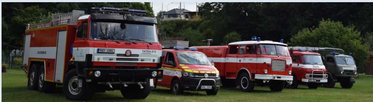
Zleva: cisternová automobilová stříkačka CAS-32 Tatra 815 (SDH Malé Svatoňovice) - dopravní automobil DA-LZZ Volkswagen Transporter (SDH Malé Svatoňovice).