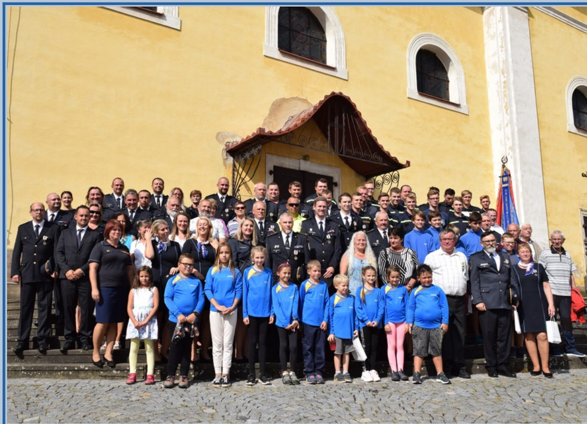
Společná fotografie účastníků slavnostního ceremoniálu oslav 150 let hasičů v Malých Svatoňovicích pořízená na schodech před Kostelem Sedmi radostí Panny Marie.