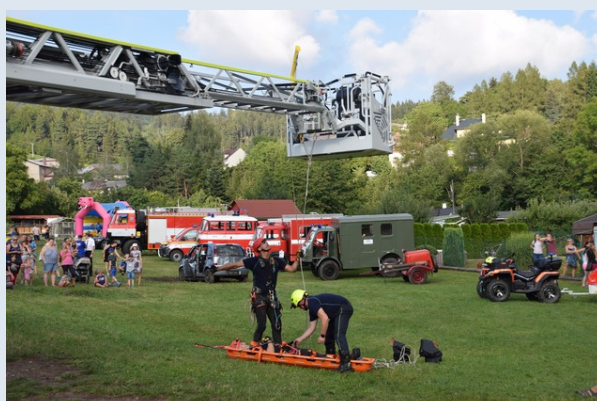
Ukázka záchranu zraněných osob z výšky (HZS Královéhradeckého kraje, stanice Trutnov).