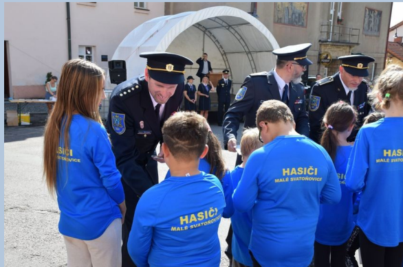
Mladí hasiči obdrželi pamětní mince.