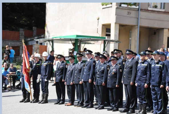
Praporová četa zaujala čestné místo v nástupovém tvaru hasičů SDH Malé Svatoňovice.