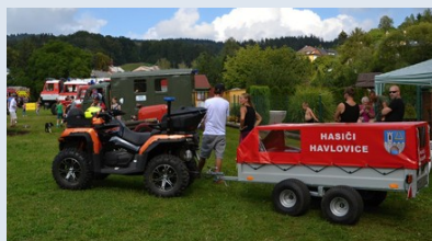
Zásahová čtyřkolka CFmoto Gladiator X1000 V-Twin EPS (SDH Havlovice)