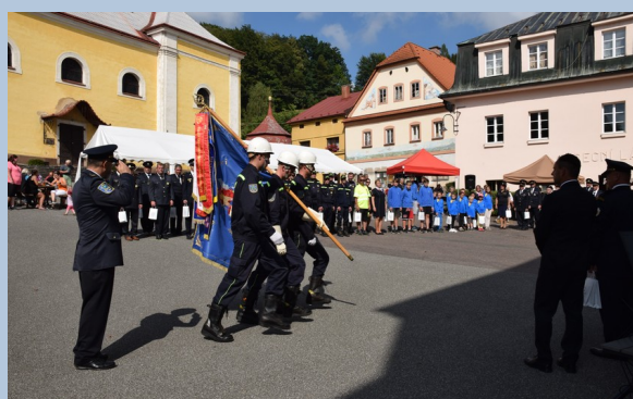
.... který po více než hodině skončil odchodem praporevé čety.