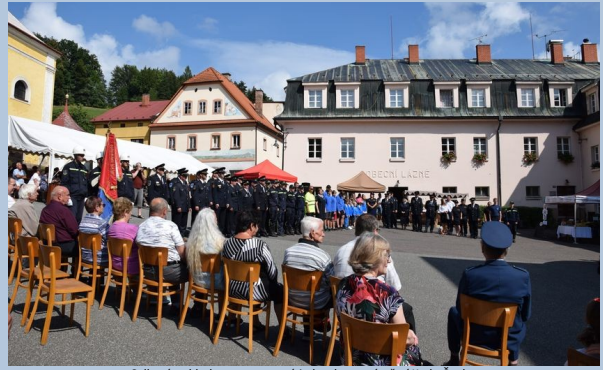
Celkový pohled na nastoupené jednotky na náměstí Karla Čapka.