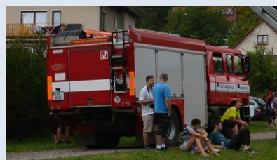
Cisternová automobilová stříkačka CAS-20 - S2R Tatra (SDH Červený Kostelec)