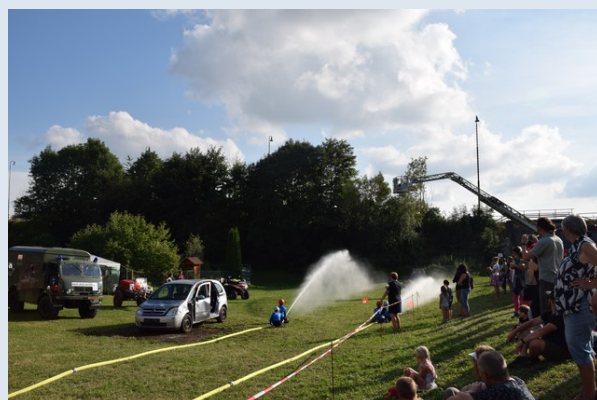
Ukázka požárního útoku mladých hasičů za použití stříkačky PS-12 (SDH Malé Svatoňovice).