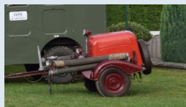
Dvoukolová stříkačka DS-16 (SDH Malé Svatoňovice)